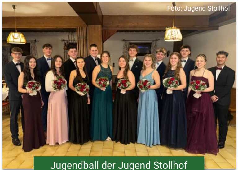
Jugendball der Jugend Stollhof